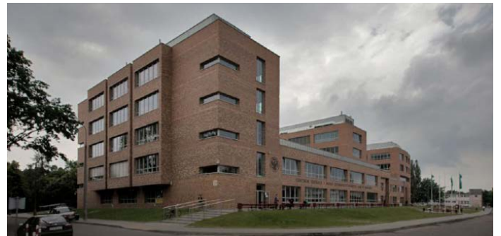
Foto: Siedziba Wydziału Nauk Historycznych i Społecznych UKSW.

Z tej okazji zapraszamy na ul. Wóycickiego 1/3, do Auditorium Maximum UKSW. Uroczystościom będą towarzyszyły wykłady mistrzowskie, prelekcje i wiele innych atrakcji, wśród których pozwalamy sobie wymienić również stoisko wydawnicze z nowościami z zakresu nauk społecznych. Więcej informacji na temat wydarzenia na stronie www.wnhis.uksw.edu.pl .