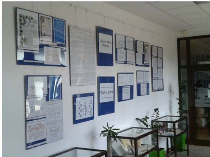
Na zdjęciu: Część zbiorów wystawy - hall Biblioteki Głównej UKSW, przy ulicy Dewajtis 5 (Nowy Gmach).

Wydawnictwo Uniwersytetu Kardynała Stefana Wyszyńskiego