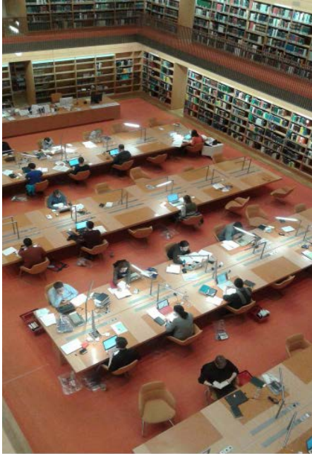
Staatsbibliothek zu Berlin